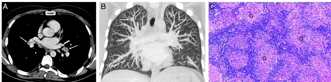
Figura 1. A) Imagen axial de TC de tórax (ventana de mediastino) en la que se visualizan adenopatías bilaterales hiliares simétricas (flechas). B) Reconstrucción coronal MIP (proyección de intensidad máxima) de TC de tórax (ventana de parénquima pulmonar) en la que se detectan nódulos pulmonares bilaterales de predominio en lóbulos superiores (flechas). C) Imagen histológica de un nódulo pulmonar resecado por videotoroscopia en la que se observan granulomas no necrotizantes (G) formados por histiocitos epitelioides sin celularidad neoplásica.

Creemos que el conocimiento de la RS como un cuadro simulador de enfermedad metastásica en algunos pacientes con cáncer testicular es fundamental para su manejo óptimo, evitando un