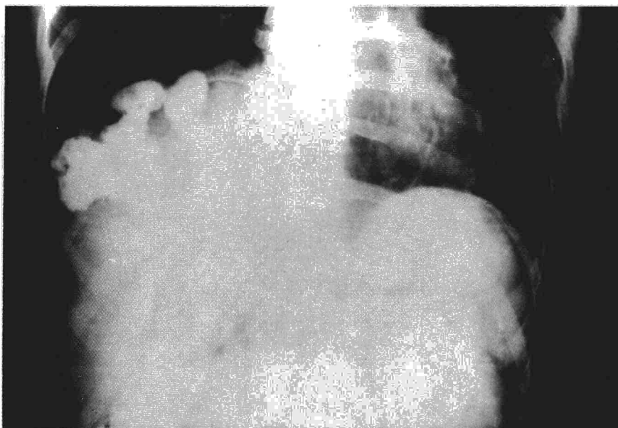
Fig. 3. M.M.G. Asa de colon con contraste en hemitórax derecho.