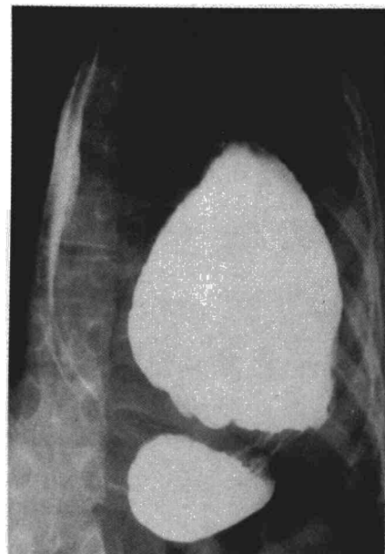
Fig. 4. Estómago intratorácico, volvulado, que pasa a través de una pequeña brecha.

describir un estadio agudo con síntomas y signos cardio-pulmonares (disnea, taquicardia, hipotensión, etc.) que nos llaman la atención y nos hacen pensar en el diagnóstico correcto. Esto sucedió en tres de nuestros casos. Un segundo estadio latente que puede ser asintomático o ser confundido con una dispepsia gástrica o biliar y que puede durar semanas, meses o años. En esta fase se diagnosticó a dos de nuestros pacientes. (figs. 3 y 4).