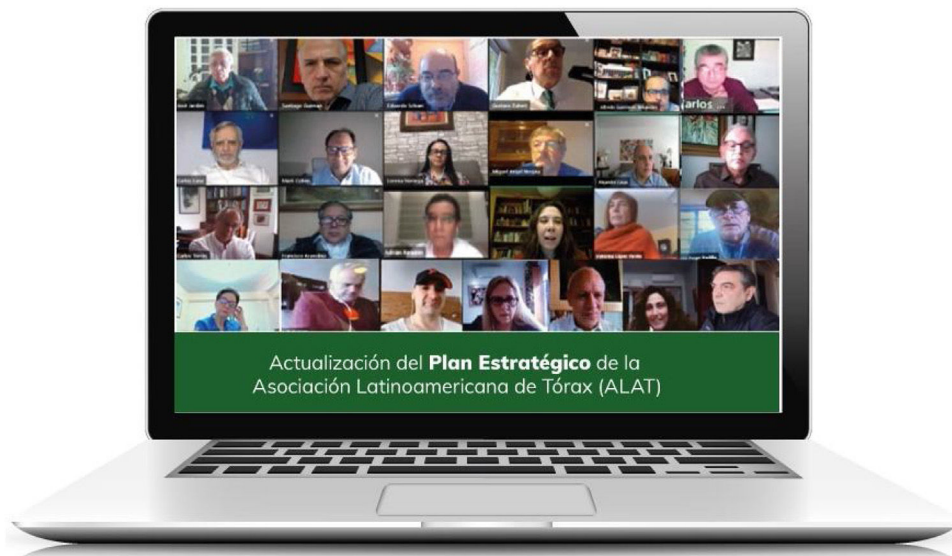
Figura 1. Participantes en el Plan Estratégico de ALAT 2021-2026.