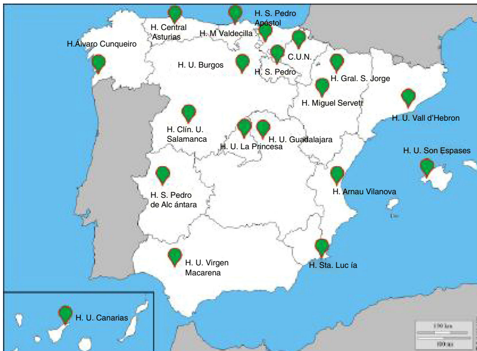
Figura 1. Localización geográfica de los 19 centros hospitalarios participantes en EPISCAN II.

listado de números de teléfono aleatorios estratificados de acuerdo con dichos códigos postales y cuotas de sexo y grupos de edad 7 . En la segunda etapa, tras contactar telefónicamente con los potenciales participantes y realizarles unas breves preguntas sobre su