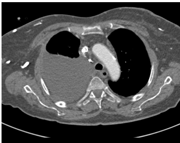
Figura 1. Derrame pleural derecho. Catéter en vena cava superior.

© 2016 SEPAR. Publicado por Elsevier España, S.L.U. Todos los derechos reservados.