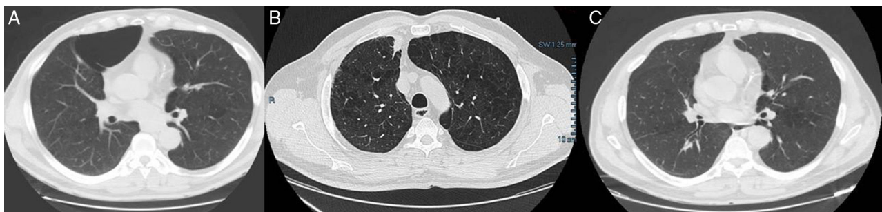
Figura 1. Imágenes de la TC donde se objetiva gran bulla en LSD (A), nódulo pulmonar espiculado en LSD y la desaparición de la gran bulla a ese nivel (B), e imagen tras resección quirúrgica del nódulo pulmonar donde se sigue observando la ausencia de la gran bulla enfisematosa pulmonar (C).