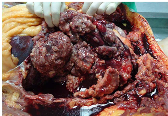
Figura 1. Visión durante la autopsia de la cavidad torácica: se observan múltiples implantes neoplásicos de aspecto nodular a nivel de pleura visceral, así como moderada cantidad de líquido pleural sero-hemático.

En conclusión, el caso de nuestra paciente parece seguir igual patrón a los casos descritos en la literatura hasta el momento, aunque con menor tiempo transcurrido entre la aparición del tumor primario y la clínica respiratoria y, por tanto, con una muerte más prematura (a los 6 meses del diagnóstico). Se observó también una agresividad mayor a las descritas con metástasis tanto en región quirúrgica como a distancia, en tiempos de evolución muy cortos. Por lo que ante un caso de endimoma anaplásico grado III de la OMS, debemos tener en cuenta la afectación pleuropulmonar como una posible complicación incluso al poco tiempo de la aparición de la lesión intracraneal, como ocurrió en nuestro caso.