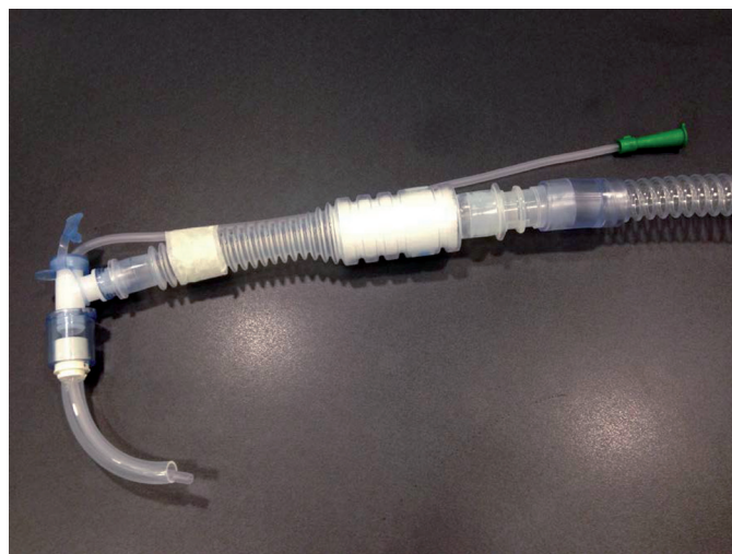
Figura. Conexión para aspiración.

Material y métodos: La aspiración no invasiva de secreciones consiste en el uso simultáneo de in-exuflaciones mecánicas (Cough-assist; Respiroics) y aspiración de secreciones en la misma cánula de TM mediante una pieza en L que permite la conexión de ambos sistemas a la vez. Se describe la experiencia de 30 situaciones clínicas en las que estaba indicada la aspiración de secreciones (caída de la SpO 2 y/o presencia de secreciones audibles que dificultan la respiración y provocan disconfort) en 3 enfermos con patología neuromuscular (2 de ellos portadores de Ventilación mecánica invasiva -VMI- en modalidad de presión de soporte). Se analizaron los cambios en la SpO 2 , las molestias y las complicaciones durante el procedimiento, así como la