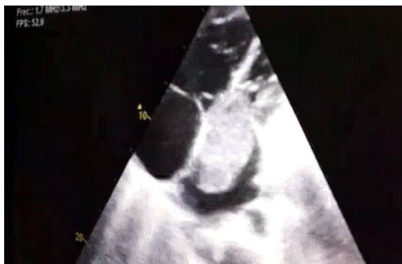
Figura 1. Ecocardiografía donde se objetiva una masa de gran tamaño en aurícula izquierda (6,3 × 3,2 cm) que protruye en diástole hacia el ventrículo izquierdo.

intravasculares. Además se solicitó estudio de trombofilia, comprobándose que la paciente era portadora heterocigótica de la mutación del factor v de Leiden.