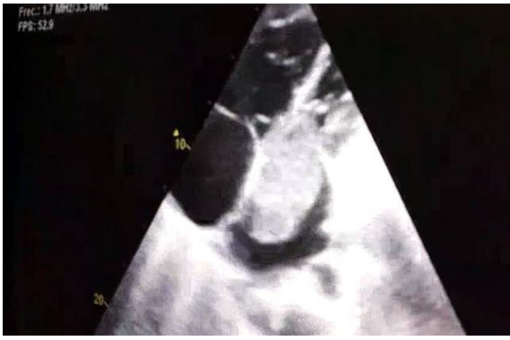
Figura 1. Ecocardiografía donde se objetiva una masa de gran tamaño en aurícula izquierda (6,3 × 3,2 cm) que protruye en diástole hacia el ventrículo izquierdo.

intravasculares. Además se solicitó estudio de trombofilia, comprobándose que la paciente era portadora heterocigótica de la mutación del factor v de Leiden.