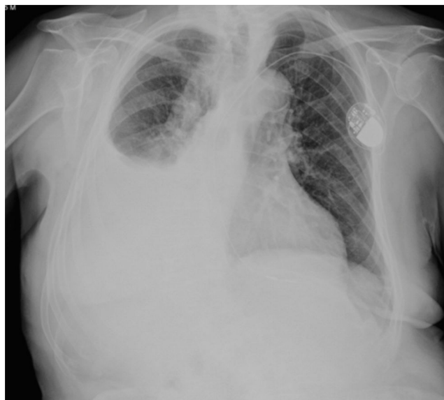
Figura 1. Radiografía posteroanterior de tórax. Extenso derrame pleural derecho. Marcapasos endocavitarios.

Nuestro caso presenta la peculiaridad de demostrar la presencia de bacilos en el líquido pleural, lo que nos permite el diagnóstico de derrame pleural secundario a diseminación de BCG, tras instilación intravesical, al año de haber recibido este tratamiento. También es poco común la complicación como derrame pleural. En la literatura solo hemos encontrado un caso similar de derrame pleural 6 años después de haber recibido tratamiento con BCG pero en él no se consiguió aislar la micobacteria en el líquido 7 .