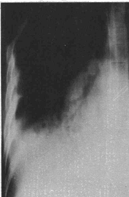
Fig. 2. Tomografía mostrando: imagen tumoral endobronquial a nivel del lóbulo intermedio. Broncograma aéreo y condensación lóbulos inferior y medio.

y metastatizan más frecuentemente, estas metastasis tienen una predilección por los órganos intratorácicos. Los mucoepidermoides tienen un potencial evolutivo poco conocido 4 .