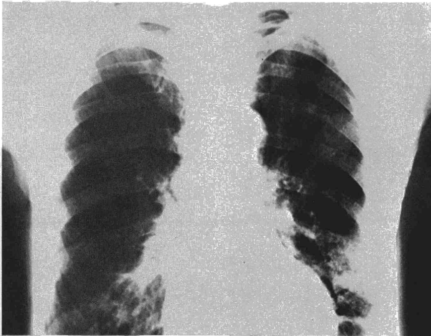
Fig. 3. Evolución favorable de las alteraciones radiológicas a los 4 días.

Otro factor que se debe valorar es si el derrame o el neumotórax llevaban varios días de evolución. En nuestro caso el paciente llevaba cinco días con el neumotórax y la presión de aspiración empleada fue de 20 cc. de H 2 O. Estudios experimentales en animales apoyan la importancia de las anteriores afirmaciones 11 . Según los mismos para prevenir el edema se recomienda no