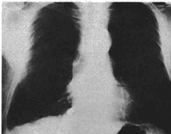
Fig. 1. Radiografía posteroanterior al ingreso, con el cuerpo extraño proyectado en el ángulo cardiopréncico derecho.

Con la inducción de la anestesia se colocó un tubo de Carlens para ventilación selectiva del pulmón izquierdo y aislamiento