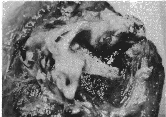
Fig. 3. Pieza de resección: la punta de la bala (recubierta de una costra negruzca) atravesando la pared bronquial engrosada (blanquecina).