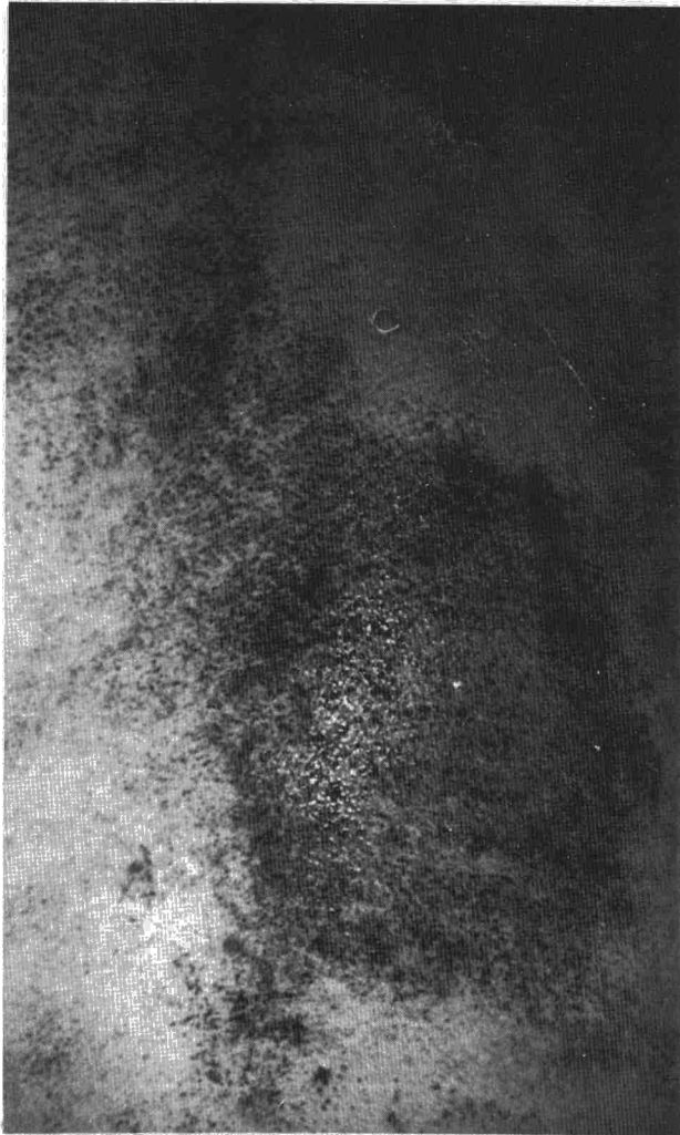
Fig. 1. Test del sudor con almidón y yoduro potásico. Hiperhidrosis localizada en hemitórax derecho, por debajo de la cicatriz de toracotomía.