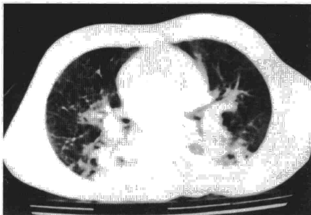
Fig. 2. TAC torácica al ingreso.

Existen muy pocas publicaciones de casos con neumonitis nodular en niños sin patología de base y diagnosticada in vivo 5 . En nuestra paciente, es curioso el hecho de que, tras un episodio de atragantamiento casi mortal, tras el vómito y las maniobras de reanimación se produjo una microaspiración masiva y difusa con predilección en las zonas de decúbito. La