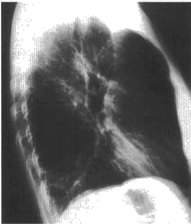
Fig. 1. Radiografía de tórax lateral. Obsérvese el aumento de tamaño de la tráquea (50 mm de diámetro) con aspecto corrugado de la pared anterior. Infiltrado neumónico en el lóbulo inferior y el lóbulo medio.

ocasión, hemoptoico. Ingresó en el hospital por persistencia de esputo purulento, fiebre y disnea a pesar de tratamiento antibiótico. En la exploración física se observó temperatura de 39 °C; en la auscultación pulmonar, crepitantes y roncus. El abdomen y extremidades eran normales. En la analítica tenía 11 \times 10^3 leucocitos (78% de PMN, 10% linfocitos, 2% de eosinófilos). La hemoglobina, hematocrito, plaquetas, VSG, bioquímica hepática y renal eran normales. La cuantificación de alfa-1-antitripsina, inmunoglobulinas, subclases de IgG y test de cloro en sudor también fueron normales. La radiografía de tórax mostró infiltrados en lóbulo inferior derecho y lóbulo medio con aumento del diámetro de la tráquea (fig. 1). La gasometría arterial basal mostró: pH 7,43, PCO_2 32 mmHg, PO_2 69 mmHg. Se inició tratamiento antibiótico y broncodilatador mostrando buena evolución. A su alta la gasometría arterial, la espirometría, volúmenes pulmonares y difusión eran normales. En la TAC se confirmó la existencia de TBMG y no se observaron bronquiectasias ni otras alteraciones pulmonares.