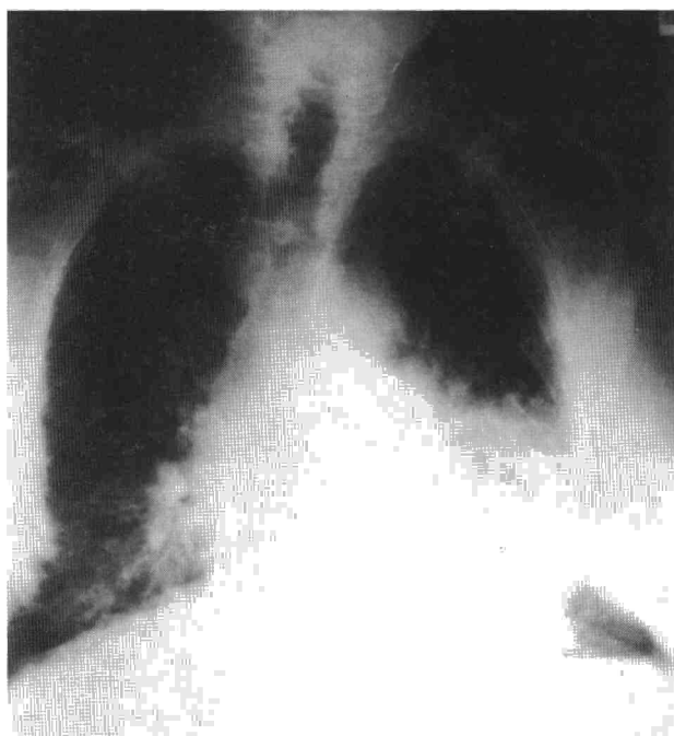
Fig. 1. Radiografía de tórax: infiltrado alveolar difuso y patrón reticular en ambas bases.