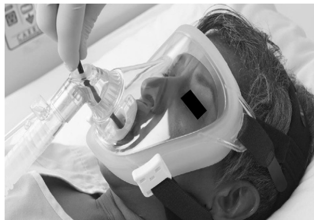
Figura 1. Mascarilla facial para ventilación mecánica no invasiva con diafragma para la entrada del fibrobronoscopio. Inserción por vía bucal a través de mordedor.

Algunos autores han propuesto modificaciones en las interfases y se basan en la presencia de un segundo orificio con un diafragma