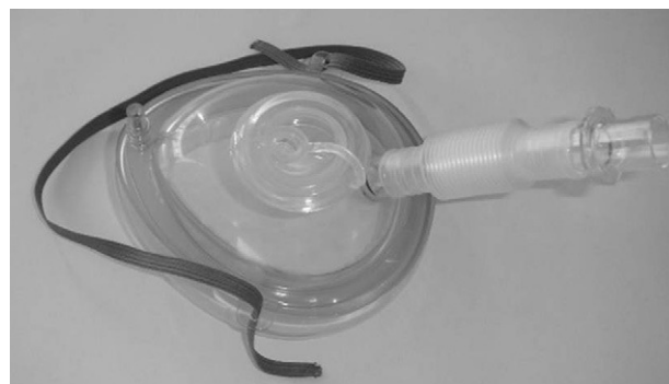
Figura 2. Variante de mascarilla oronasal dotada de un diafragma de inserción, independiente del canal de suministro de la ventilación mecánica no invasiva.

La VMNI no implica necesariamente una mayor sedación. De hecho, no se desaconseja, aunque es fundamental disponer de la experiencia necesaria en el manejo de fármacos. Para la anestesia tópica suele emplearse la lidocaína, siguiendo el procedimiento habitual de la FBC. Algunos autores proponen el empleo de propo-