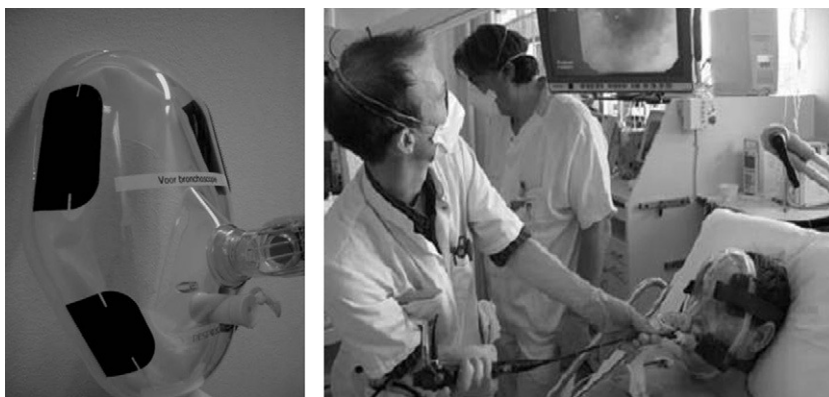
Figura 5. Máscara facial para ventilación mecánica no invasiva a la que se le ha acoplado una pieza cilíndrica fenestrada para la inserción del fibrobroncoscopio.

Menos frecuentes son las complicaciones mayores de tipo cardiovascular (arritmias malignas, síndrome coronario agudo, paro cardíaco), que pueden minimizarse por una adecuada selección del paciente y la monitorización durante la FBC.