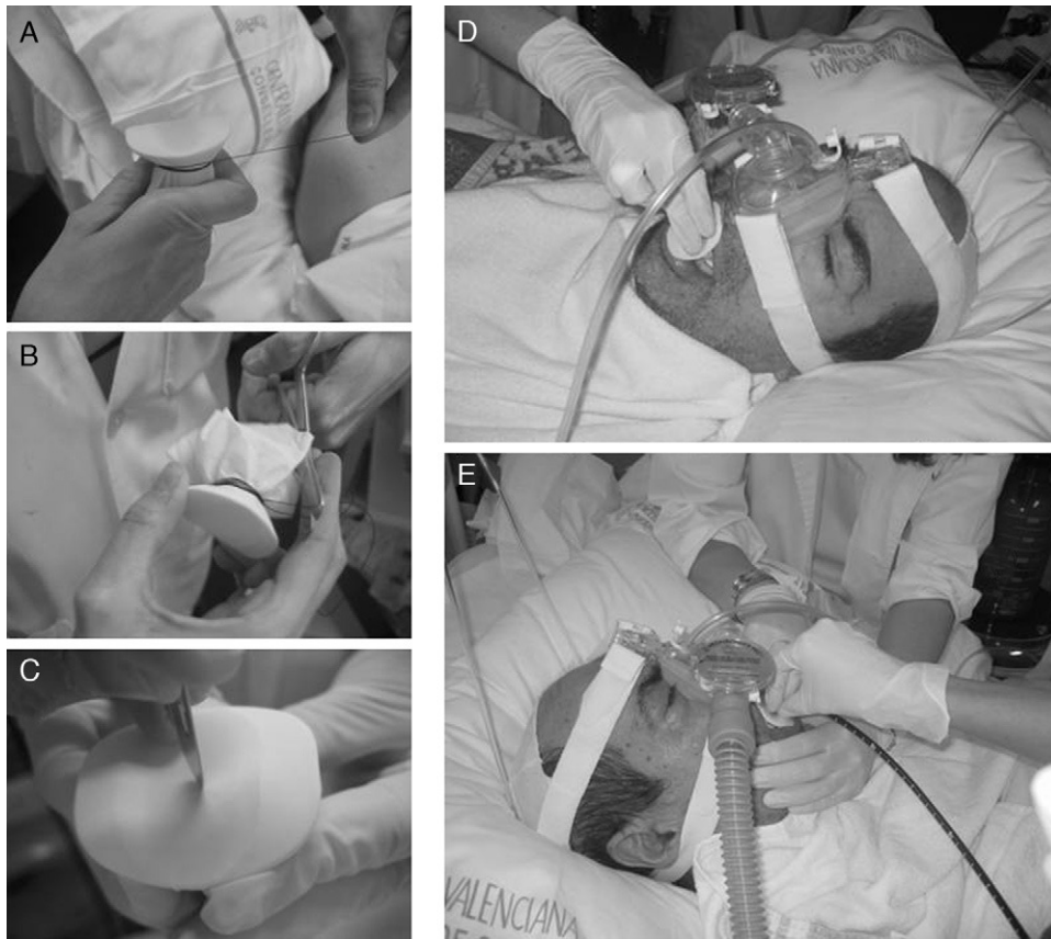
Figura 7. Ventilación mecánica no invasiva practicada con máscara nasal e inserción del fibrobroncoscopio por vía bucal. A) Introducción del mordedor bucal en un guante de látex y sujeción con un hilo de sutura. B) Recorte del material sobrante. C) Mínima incisión en la membrana del mordedor. D) Introducción del mordedor bajo ventilación mecánica no invasiva. E) Inserción del broncoscopio por vía bucal y realización de la técnica con ventilación no invasiva.