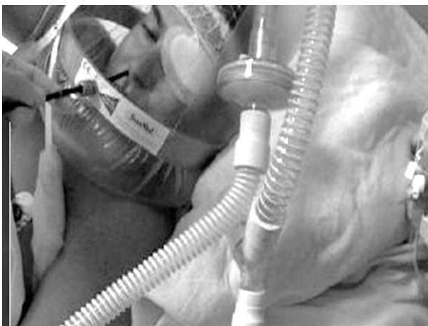
Figura 4. Interfase tipo Helmet para ventilación mecánica no invasiva. Inserción del fibrobronoscopio a través de pieza fenestrada y realización de la técnica por vía nasal o bucal.

Existen también otras complicaciones propias de la FBC (desaturación, sangrado, mala colaboración, agitación, etc.), para cuya resolución se procederá como en un procedimiento habitual de FBC.