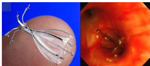
Figura 1. Aspecto de una válvula IBV desplegada y visión endoscópica tras su colocación.