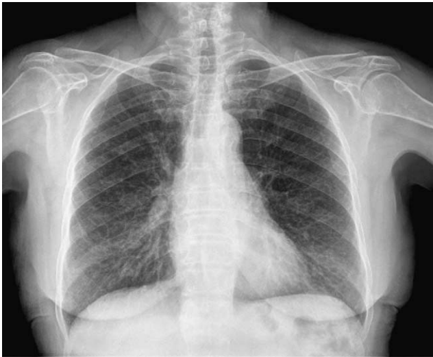
Figura 1. Radiografía de tórax que muestra un patrón intersticial.

La exploración física fue normal, con saturación de oxígeno del 98%. Únicamente en la región periorbitaria destacaban unas discretas lesiones cutáneas indicativas de angiofibromas, sin detectarse lesiones en ninguna otra región corporal. En la radiografía de tórax (fig. 1) se observó un patrón intersticial, y la tomografía computarizada (fig. 2) evidenció múltiples imágenes quísticas en todo el campo pulmonar de ambos hemitórax, de morfología redonda y pared fina, sin estructuras vasculares en su interior ni engrosamiento de los septos. En la exploración funcional respiratoria la capacidad vital forzada (FVC) era de 1.970 ml (un 68% del valor teórico), el volumen espiratorio forzado en el primer segundo (FEV 1 ) de 1.260 ml (un 61% del valor teórico) y FEV 1 /FVC de 63,65%. Se practicó una fibrobroncoscopia con lavado bronquioalveolar y biopsias transbronquiales. El estudio anatomopatológico (fig. 3) de las biopsias estableció el diagnóstico de linfangiomatosis pulmonar. Se llevó a cabo un estudio de receptores hormonales, que mostró positividad leve para los