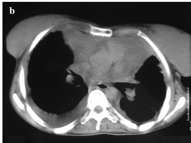
Fig. 2. Desaparición del infiltrado pulmonar tras la radioterapia (a) y reducción de la tumoración mediastínica tras la radioterapia (b).

moglobina de 9,1g/dl, 103.000/nl de plaquetas y 13.700/nl de leucocitos con fórmula normal. La coagulación y bioquímica fueron normales. La cifra total de proteínas era baja (4,9 g/dl) y la de albúmina, de 1,82 g/dl. En la radiografía posteroanterior y lateral de tórax se evidenció un derrame pleural izquierdo masivo. Se procedió a la colocación de un tubo de drenaje torácico para su evacuación y se mantuvo durante 6 días.