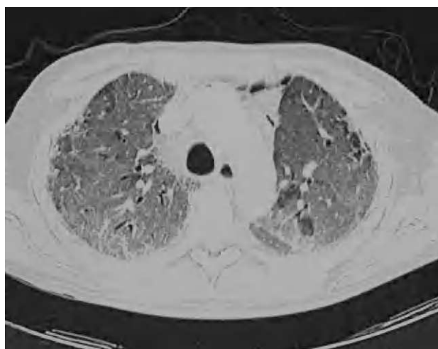
Figura 1. Patrón radiológico, típico de la fibrosis pulmonar idiopática, con afectación intersticial de predominio basal y periférico, engrosamiento septal, líneas subpleurales, áreas de panalización y bronquiectasis por tracción.