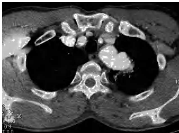
Fig. 2. Pseudoaneurisma en la aorta torácica objetivado en la angiorresonancia.

La fístula aparece por la acción de distintos factores. En los casos secundarios a intervenciones quirúrgicas con inserción de material protésico, como sucede en la