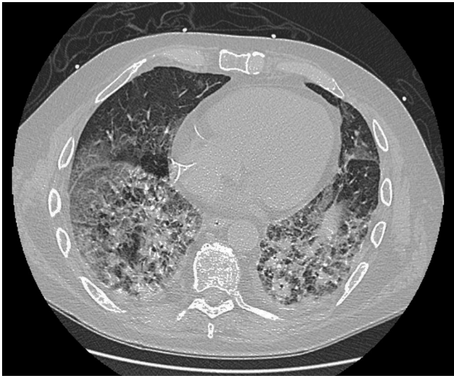
Figura 1. TC durante el ingreso, donde se observa importante afectación parenquimatosa, en comparación con TC previa, un mes antes, coincidiendo con el último ciclo de quimioterapia, que resultó normal.

por hecho que la antibioterapia recibida no había sido eficaz con imposibilidad de obtener nueva muestra de esputo por improductividad de la tos, se realizó una fibrobroncoscopia en la que tampoco se obtuvieron aislamientos microbiológicos en las muestras recogidas. Tras esta última prueba presentó un nuevo pico febril y deterioro aún mayor de la disnea con muy mal estado general, por lo que se realizó una tercera radiografía de tórax que mostraba nuevo empeoramiento con respecto a la previa 24 h antes. Se reforzó el tratamiento con vancomicina y cotrimoxazol, con retirada del catéter reservorio por si pudiera suponer un foco infeccioso añadido, y se trasladó finalmente a la UCI por desaturación en torno al 75% a pesar de alto flujo de oxígeno. Los hemocultivos extraídos del catéter y vía periférica fueron ambos negativos, así como el cultivo de la punta de catéter. Se completó estudio de la disnea con un ecocardiograma, también normal. Todas las serologías incluyendo HIV, virus hepatotropos, VEB, CMV, Mycoplasma pneumoniae y Chlamydia pneumoniae , fueron negativas. La PCR para CMV, Ag de influenza A/B y galactomanano también lo fueron. Tampoco se obtuvo ningún resultado positivo en el estudio de autoinmunidad.